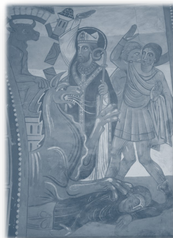
Photo 1 : Julien et le miracle de la fontaine, fresque de Ponce-sur-Loir

Aujourd'hui, deux villages du sud de l'Italie et de la Sicile sont sous la protection de Saint-Julien du Mans. Il est fêté le 27 janvier.